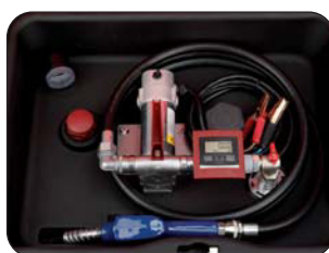
Avec compteur digital Met digitale teller