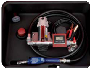
Avec compteur digital Met digitale teller

Adaptation des formes de la citerne pour permettre le passage de roue dans le pick-up De vorm van de tank is zo aangepast dat hij tussen de doorgang van de wielen past