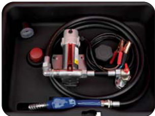
Installation standard Standaard uitvoering