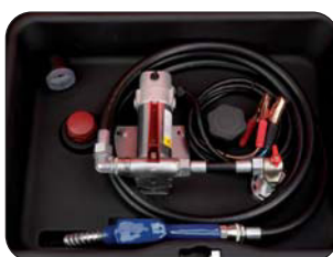
Installation standard Standaard uitvoering